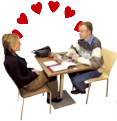
...i patnáct kandidátů na muže vašeho srdce.