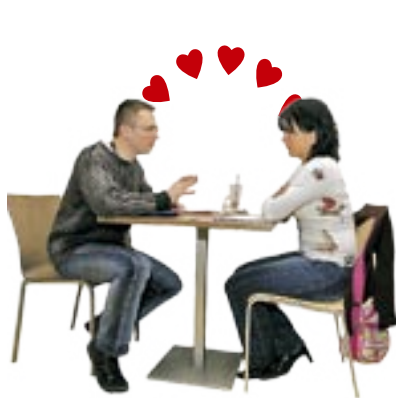
Během jednoho rande poznáte třeba...